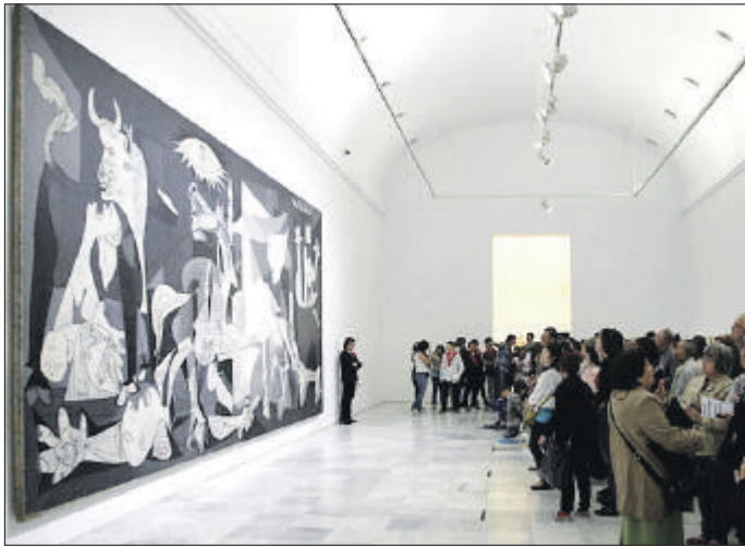
MUSÉE REINA SOFIA. Madrid accueille une exposition sur le cheminement artistique qui a mené au chef-d'oeuvre.