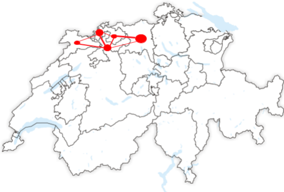
Cartes 1-3 : Wikimedia Commons 11

Des clusters régionaux sont envisageables non seulement pour la mise en commun de services, mais aussi pour la mise en commun d'infrastructures : Un "espace de numérisation de la Suisse du Nord-Ouest" (SO, BL, BS, JU, AG) pourrait être créé, dans lequel l'ensemble de l'infrastructure informatique de base serait déployée sur l'ensemble du territoire et du canton. Au lieu de l'autonomie communale, il existe une "supercommune" numérique en tant que centrale avec des petits hubs communaux. Les tâches seraient centralisées ; le contact physique resterait décentralisé.